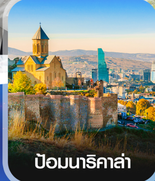
ป้อมนาริกาล่า