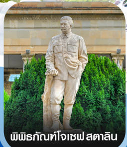
พิพิธภัณฑ์โจเซฟ สตาลิน

คอนเฟิร์มออกเดินทาง ทุกพีเรียด 2 ท่านขึ้นไป