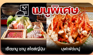
เมนูพิเศษ เร็นชามู ซามู สลัดสตูปูน บูฟฟัดตปู

โตเกียว-คามิโคจิ-แม่น้ำฟูจิ-เมืองเก่าคาวาโกเอะ-หมู่บ้านน้ำใส-พักโรงแรมออนเซ็น-เที่ยวเต็มไม่มีอิสระ