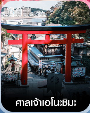
ศาลเจ้าเอโนะชิมะ