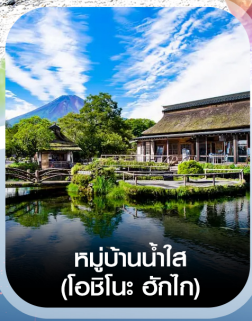
หมู่บ้านน้ำใส (โอบิโนะ อักโก)