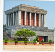
สุสานโฮจิมินห์