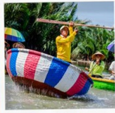
เรือกระดิง