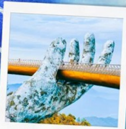
บาน่าฮิลล์