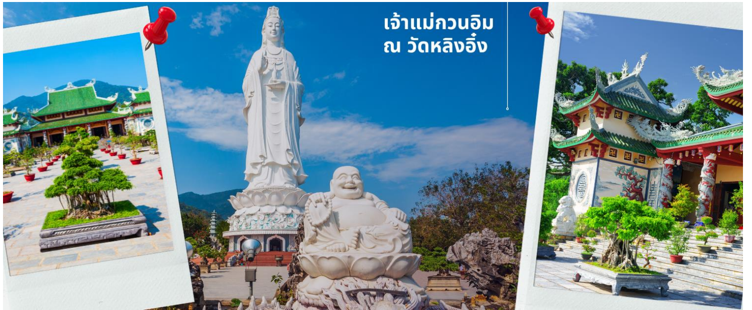
เจ้าแม่กวนอิม ณ วัดหลิงอิ่ง

นำท่านมัศจรรย์องค์ เจ้าแม่กวนอิม ณ วัดหลิงอิ่ง อยู่บนเกาะเซินตรา (Son Tra) ทางเหนือของเมืองดานัง เป็นวัดใหญ่ที่สุดของที่นี่ รูปปั้นปูนขาวของเจ้าแม่กวนอิมยืนหันหลังให้ภูเขา หันหน้าออกสู่ทะเลเพื่อเป็นการปกป้องคุ้มครองชาวประมงที่ออกไปหาปลา เสียงระฆังวัดที่ตีประสานกับเสียงคลื่นนั้นช่วยให้ชาวเรือรู้สึกสงบ และสร้างขวัญกำลังใจอย่างดีเยี่ยม และเป็นทีเคารพนับถือของคนดานัง