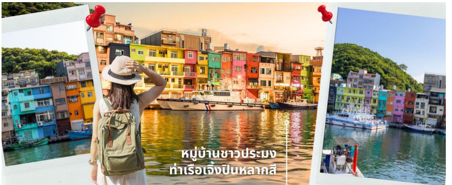
หมู่บ้านชาวประมง ท่าเรือเจิ้งปินหลากสี

นำท่านถ่านรูปสุดชิคที่ ท่าเรือเจิ้งปิน เมืองจีหลง อีกหนึ่งสถานที่ท่องเที่ยวยอดฮิตของเมืองจีหลง (Keelung) ในตอนนี้ น่าจะหนีไม่พ้น ท่าเรือประมงเจิ้งปินเป็นท่าเรือที่ใหญ่ที่สุดในไต้หวัน ทำให้ในยุคแรกๆ ท่าเรือจีหลงเจริญรุ่งเรืองเป็นอย่างมาก สำหรับที่นี่ สวย น่าเที่ยวมากๆ ต้องมาให้ได้ เพราะนอกจากจะมีบ้านหลากสีที่ตั้งอยู่ริมน้ำแล้ว ยังมีคาเฟ่เก๋ๆ มีร้านอาหาร อีกเพียบ