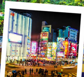
ช้อปปิ้งซีเหมินติง