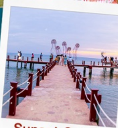
Sunset Sanato Beach Club