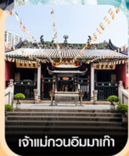
เจ้าแม่กวนอิมมาเก๊า

✈️ คอนเฟิร์มออกเดินทาง ✈️ ทุกพีเรียด 2 ท่านขึ้นไป