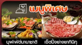
บุฟเฟ่ต์นาคาชิ เซ็ตบั้งย่างยากิโทกุ

ฟุกุโอกะ-วัดนินโซอิน-หมู่บ้านยูฟูอิน-แบบบุ-บ่อนรกจิกุ-แซ่ออนเซ็น-ช้อปิ้งเทนจิน-พักใกล้แหล่งช้อปิ้ง2คืน