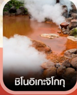
เซ็นโอะกะจิกุ

✈️ คอนเฟิร์มออกเดินทาง ✈️ ทุกพีเรียด 2 ท่านขึ้นไป