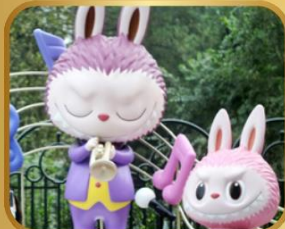
เที่ยวสนุก