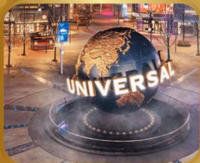
เที่ยวสนุก