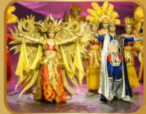
ชมสุดยอดโชว์ละครการตา