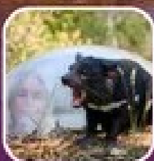
ชมสัตว์ป่าในซิดนีย์