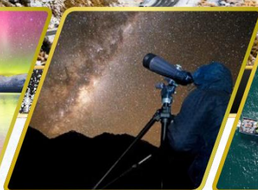
กิจกรรมชมทิวไรต์ดูดาว