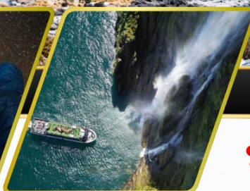
ล่องเรือมิลฟอร์ด ซาวน์