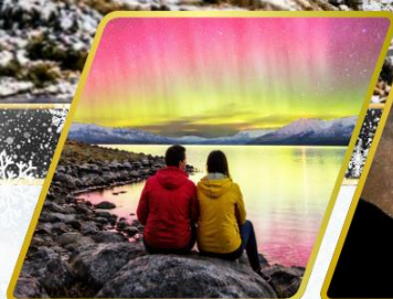
ตามล่าหาแสงใต้