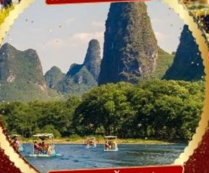
ล่องแม่น้ำหลีเจียง