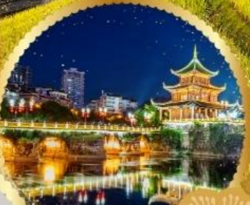
ตึกเซียวเหยา