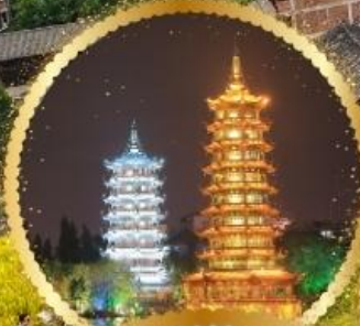
เจดีย์เงิน เจดีย์ทอง