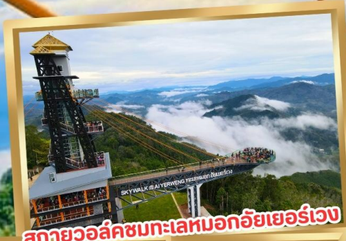
สกายวอล์คชมทะเลหมอกอัยเยอร์เวง