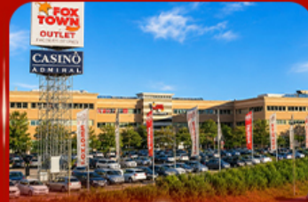
ฟ็อกซ์ทาวน์ เฉากีเลีย