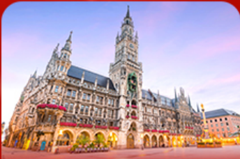
จัตุรัสมาเรียนพลัทซ์ มิวนิก