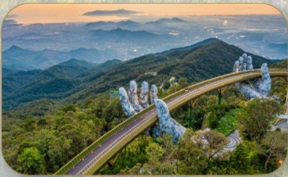
สะพานมือทองคำ