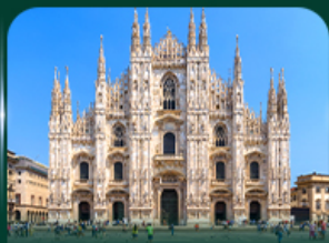
เซนต์มาทเทวอัส มหาวิหารดูโอโม มิลาน