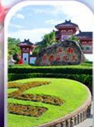
อุทยานหนานชาน

ทางเดินริมชายทะเลซานย่า • ทุ่งดอกกุหลาบอ่าวย่าหลง อุทยานหนานชาน • เทียบบนเกาะดอกไม้ • ทุ่งเกลือพันปี ช้อปปิ้งไนท์มาร์เก็ตถนนโบราณฉีหลอ