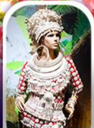
หมู่บ้านชนเผ่า