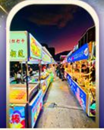
ตลาดอึ้งเหิง