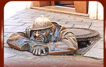
แลนด์มาร์คดัง รัมปิ้นคูนิล Bratislava