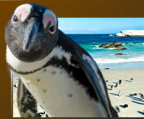
Simon's Town ชมฝูงเพนกวิน