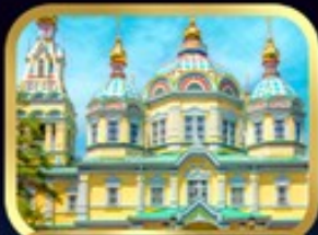
มหาวิหารเซนต์สปิริต อลมาตี