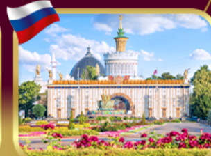
สวนสาธารณะ VDNKH