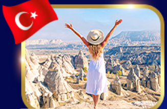
หุบเขาแห่งรัก คันทาโตเกีย