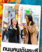
ถนนคนเดินชุนซี