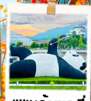
แพนด้าเซลฟ์