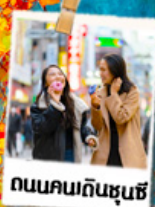
ถนนคนกินชุนซ์