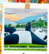
แพนด้าเซลล์ฟี