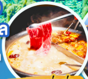
ชาบูหม่าล่า