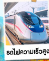
รถไฟความเร็วสูง