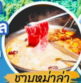
ชาบูหม่าล่า