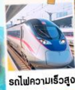
รถไฟความเร็วสูง