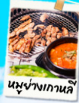
นมย้างเกาหลี