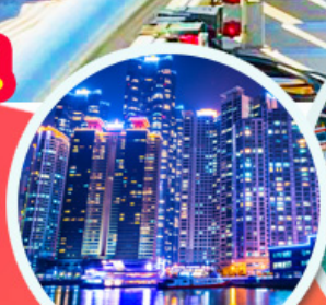
The Bay 101