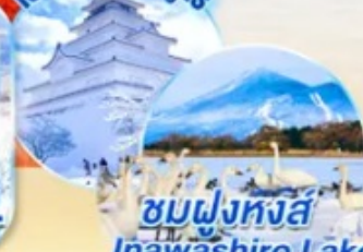
ชมฝูงหงส์ Inawashiro Lake