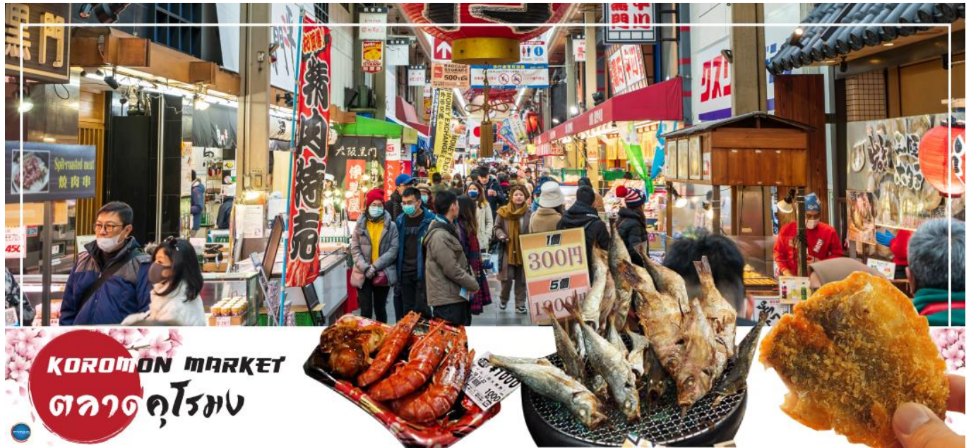
KUROMON MARKET ตลาดคุโรมง

จากนั้นนำท่านเดินทางสู่ ตลาดคุโรมง โอซาก้า (Kuromon Ichiba Market) เป็นตลาดที่มีชื่อเสียงและเก่าแก่ที่สุดแห่งหนึ่งของเมืองโอซาก้า บรรยากาศภายในเป็นทางเดิน Arcade เล็กๆ ทอดยาวประมาณ 600 เมตร 2 ข้างทางจะเต็มไปด้วยร้านค้าต่างๆกว่า 160 ร้านค้าขายทั้งของสด และแบบพร้อมทาน มีของกินเล่นและอาหารพื้นเมืองมากมายหลายชนิดให้ได้ชิมกัน