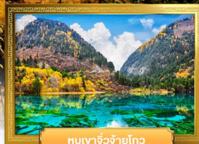
หุบเขาจิวจ้ายโกว