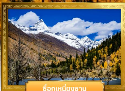
ชื่อกุเหนียงซาน