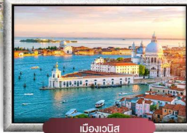
เมืองเวนิส

☑️ ซุปping 4 เมือง ปารีส อินทอลากัน มิลาน โรม