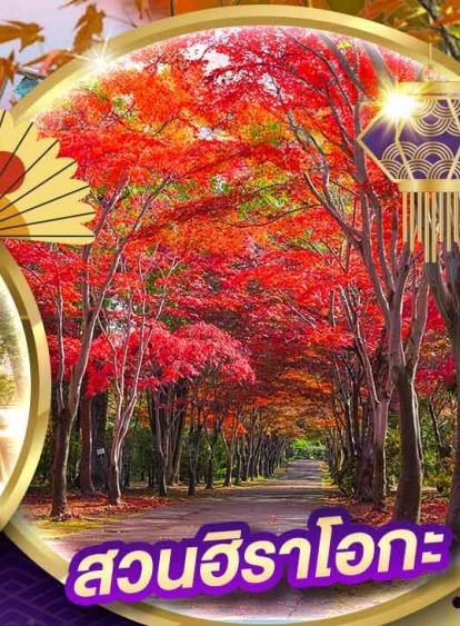
สวนอิระโอกะ