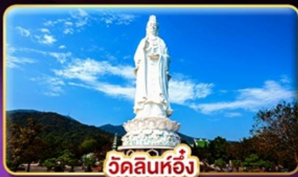
วัดลินห์ฮ้าง