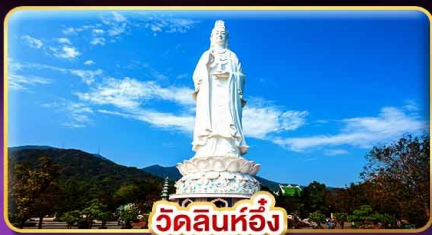
วัดลินห์ฮอิ่ง