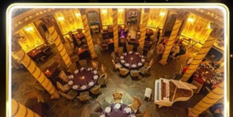
ทานอาหารสุดหรู ภัตตาคาร Turandot