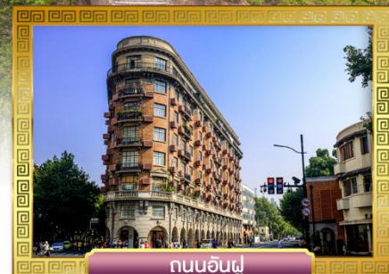
ถนนอันฟู