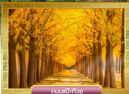
ถนนแปะก๊วย