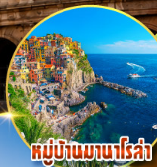
หมู่บ้านมานาโรซ่า