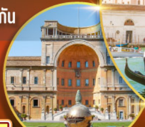
เข้าชมพิพิธภัณฑท์วาติกัน