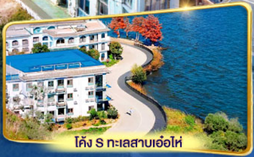
โค้ง S ทะเลสาบเอ๋อไห่