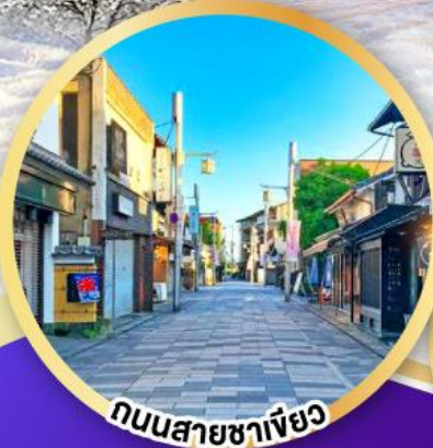
ถนนสายชาเขียว