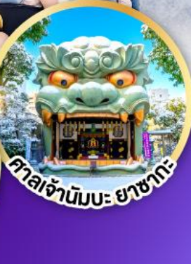
ศาลเจ้ามิมะ ยาชากะ