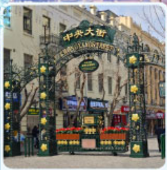
ถนนจงยาง