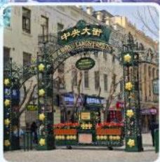
ถนนจงยาง