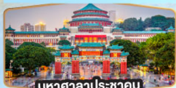
มหาศาลาประชาคม