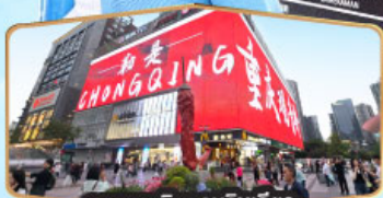
ถนนคนเดินทงวนฉีเจียว