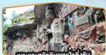
พระแกะสลักหินเขาเป่าตั้งชัน