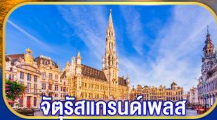
จัตุรัสแกรนด์เพลส