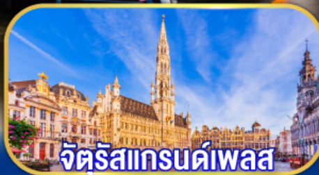
จัตุรัสแกรนด์เพลส