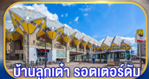
บ้านลูกเต๋า รถเตอร์ดัม

เยือนเมืองเก่าแก่ยุโรป เก็บไฮไลต์กลุ่มประเทศเบเนลักซ์ กับการบินไทย บินตรงอัมสเตอร์ดัม