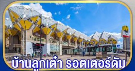
บ้านลูกเต่า รอตเตอร์ดัม

เยือนเมืองเก่าแก่ยุโรปครบถ้วน ทั่วไฮไลต์กลุ่มประเทศเบเนลักซ์ กับการบินไทย บินตรงอัมสเตอร์ดัม