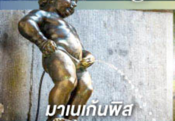
มานกันพิส