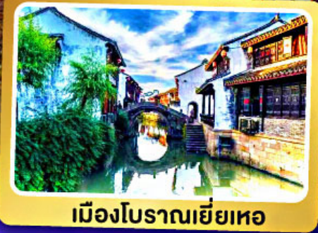
เมืองโบราณเยี่ยเหอ