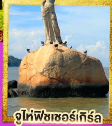
จูโหล่ฟิลาเซอร์เกิร์ล