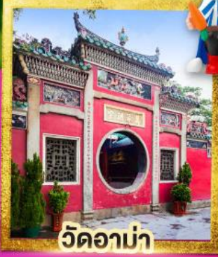
วัดอาบ่า