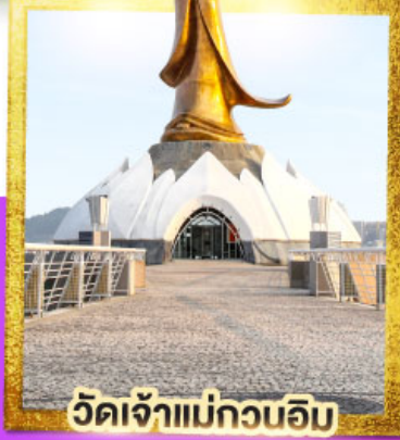
วัดเจ้าแม่กวนอิม