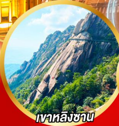
เวาหลิงซาน