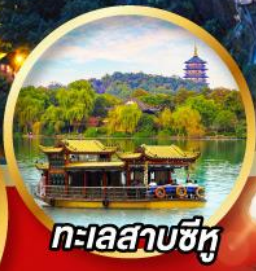
ทะเลสาบซีหู