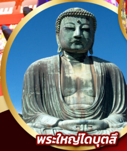
พระใหญ่ไดบุตสึ