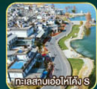
ทะเลสาบเอ๋อไห่โค้ง S