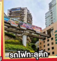
รถไฟฟ้าสุดึก