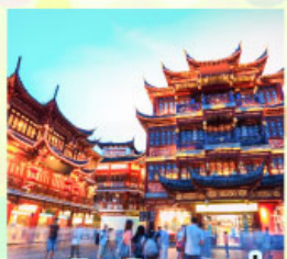
ตลาดร้อยปีเฉิงหวิงเหมียว