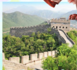
กำแพงเมืองจีนด่านจวิยงทง