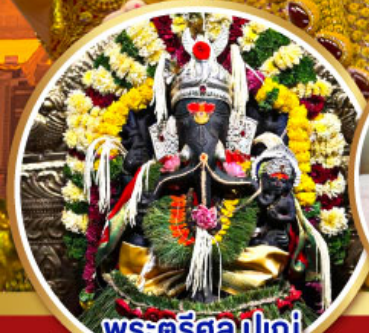
พระตรีศูล ปูเน่ (Trishul Pune)