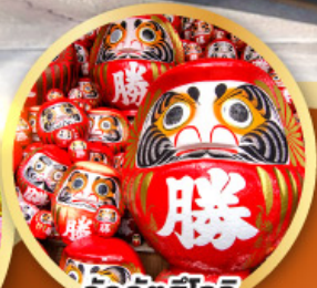
วัดคิตสึโองิ (วัดदारุมะ)

ชมความงามของกำแพงหิมะ เส้นทางสายอัลไพน์ ทากายามา (JAPAN ALPS SNOW WALL)